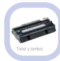
Toner y tambor