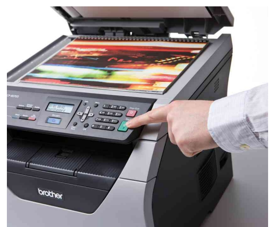
Escanee sus documentos A4 en color.

Impresora, copiadora y escáner color, todo en un equipo de alto rendimiento y que ofrece impresión dúplex automática y cartuchos de larga duración opcionales para reducir los costes.