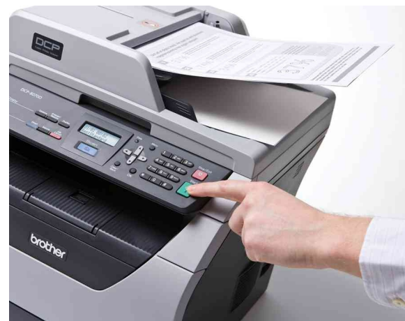
Alimentador automático de documentos. Perfecto para copiar o escanear documentos de múltiples páginas.