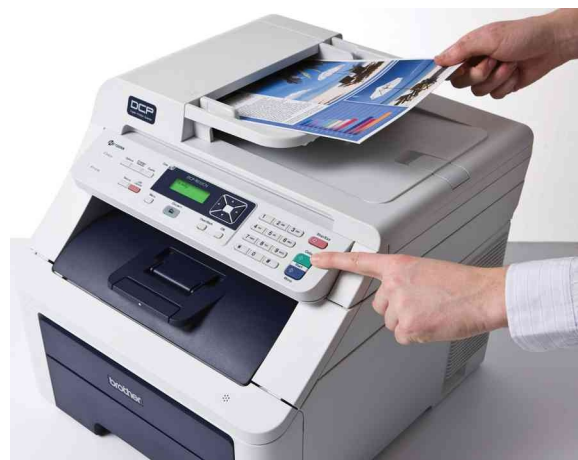
Alimentador automático de documentos (ADF) para copiar o escanear documentos de múltiples páginas.