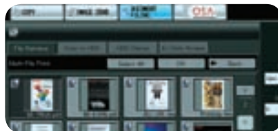
La vista con pestañas le permite el control