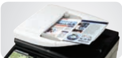
Alimentador Reversible de Paso Único de 100 hojas

Todo esto lo convierte en una MFP compacta pero sorprendentemente versátil que aumentará la productividad de todo el equipo.