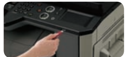
Puertos USB para imprimir directamente desde un lápiz de memoria