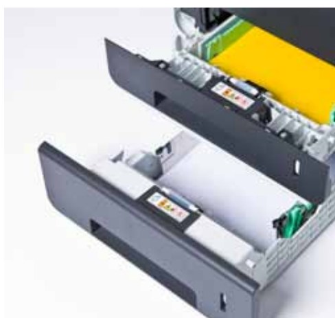
Añada una segunda bandeja para aumentar la capacidad de papel.

Encriptación SSL. Aunque los documentos son enviados desde el ordenador a la impresora en unos segundos, es tiempo suficiente para que la información pueda ser interceptada. SSL protege los datos que se envían a través de la red.