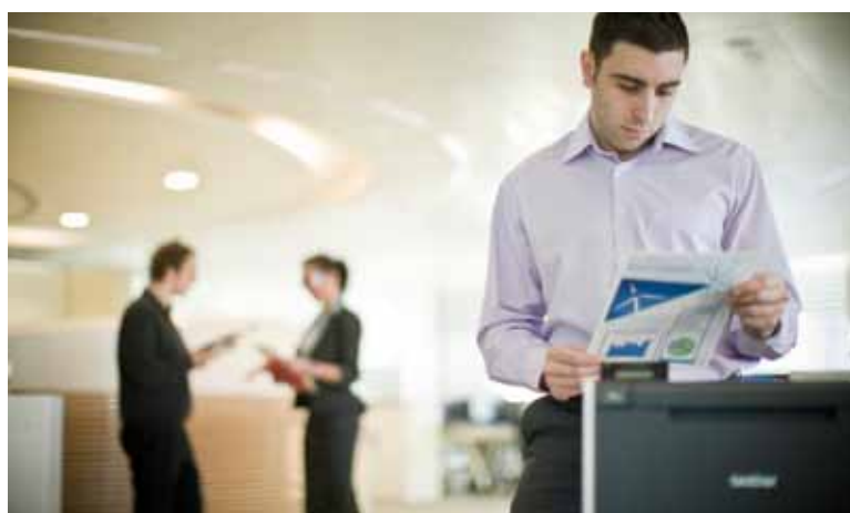
Perfecta para oficinas con mucho tráfico de trabajo: comparta recursos a través de la red.