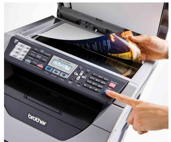
Escanee sus documentos A4 en color

Alta velocidad de impresión, calidad profesional y bajos costes en un compacto equipo multifunción láser monocromo.